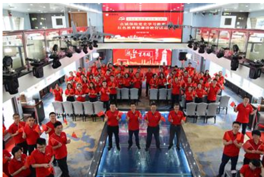
“珠江红·百年颂”珠江党史课堂

2021年4月17日，众诚保险党委组织开展党史学习教育暨廉洁教育活动，以广州市“家门口的红色学堂”中“珠江红·百年颂”珠江党史课堂为载体，通过乘坐红船的形式串联珠江沿线各红色景点，聆听广州这座城市承载的厚重红色历史，重温中国共产党一百周年以来的光辉历程，活动共计 140 余人参加，主要是引导广大党员干部坚定理想信念、牢记初心使命，从党的百年奋斗历程中不断汲取前进的智慧和奋进力量。