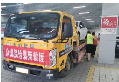
组建“支援河南突击队”

暴雨期间，我司开通理赔绿色通道，简化管理流程，采用“一次性打包定损”方式快速定损，及时设立“众诚保险应急理赔点”，妥善安置拟推定全损车辆，与客户签订协议后实施先行预赔；共处理赔案708件，累计为260台受灾车辆提供众诚保险专属救援服务，推定全损129台，河南暴雨合计赔付金额约3279万元，有力支持河南地区受灾单位复工复产及灾后重建工作。