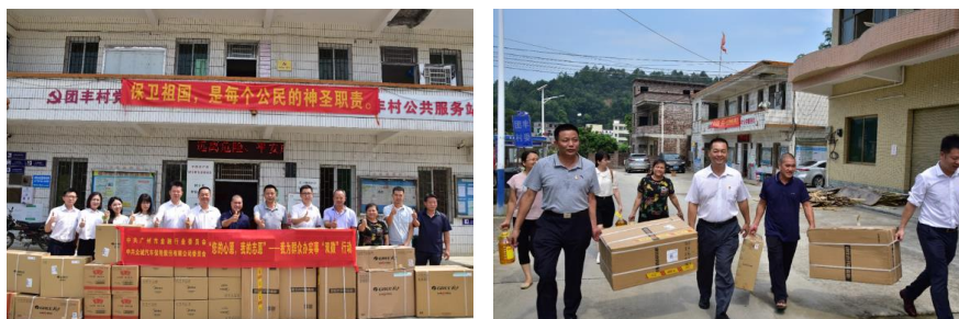
开展“微心愿”为民服务工作

2021年7月27日，众诚保险党委与广州市金融行业党委为从化区良口镇团丰村的20户困难群众点亮“微心愿”，向团丰村捐赠价值21686元帮扶物资一批，把党史学习教育的成果转化到为民服务的具体实践。众诚保险工会和呼叫中心青年文明号共同参与了此次行动。