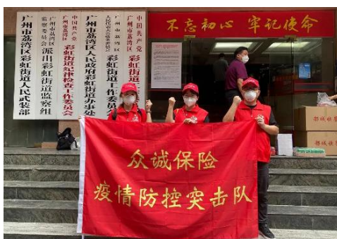
众诚保险疫情防控党员突击队

2021年5-7月，为配合做好全市疫情防控工作，众诚保险党委快速组建众诚保险疫情防控党员突击队，支援荔湾区疫情防控工作，5名突击队员第一时间投身疫情防控和灾区支援，其中，1名突击队员深入广州中高风险区三十多天为受疫情影响的群众提供生活保障，合共服务时长达165个小时，充分发挥党支部战斗堡垒作用和共产党员先锋模范作用，全力服务全市疫情防控大局，坚决打赢疫情防控阻击战。