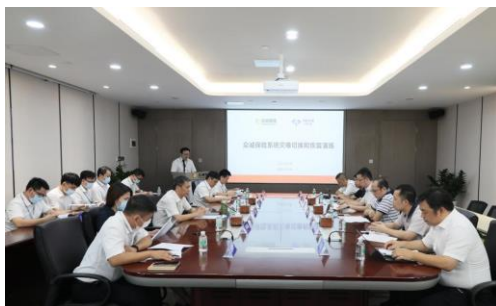
灾备中心项目沟通会

灾备切换演练的成功举办，标志着众诚保险两地三中心灾备建设的完成，达成了项目预期目标，保障了业务系统稳定和信息数据安全，切实担负起社会责任，保护消费者权益。同时，也是中保车服推动的“保险灾备云共建”向纵深发展的里程碑，特别是在云部署与云应用方面，沉淀了很多新的方法、路径和经验，有助于保险灾备云共建方案的进一步优化、推广，也将推动双方在保险服务模式与科技应用创新、保险线上化数字化转型、实施信创战略等更多领域的深入合作。